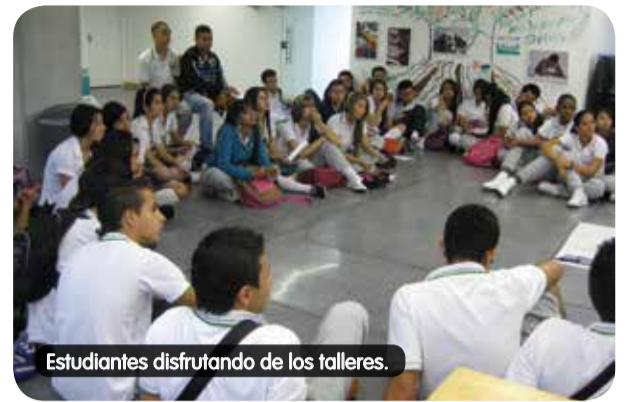
Estudiantes disfrutando de los talleres.