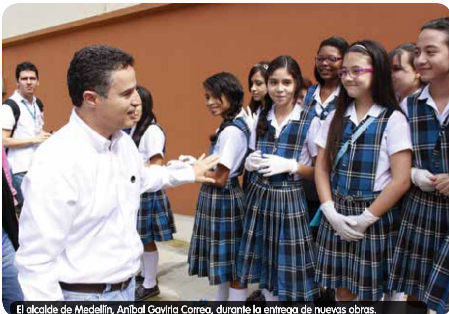
El alcalde de Medellín, Aníbal Gaviria Correa, durante la entrega de nuevas obras.

En total serán invertidos $320.000 millones en el plan de mejoramiento de la infraestructura educativa de Medellín, durante el cuatrienio.