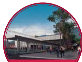
Obras Corredor Ayacucho y sus cables $631.000 millones