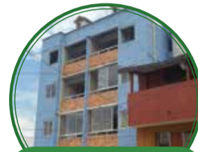
Proyecto de vivienda OPV San Pablo $595 millones