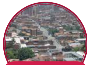
Plazoleta del Patrimonio Gastronómico de la Chunchurria $5.490 millones