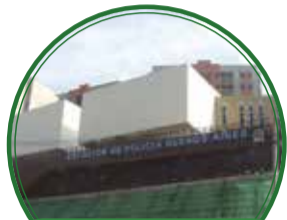
Estación de Policía Buenos Aires $7.220 millones