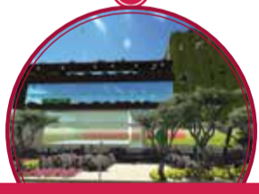
Unidad Hospitalaria Buenos Aires $54.371 millones (Incluye Unidad de Atención Integral para la Población vulnerable con énfasis en niñez, Juventud, Adulto Mayor, Mujeres y Personas con discapacidad. (JVE). $2.500 millones )