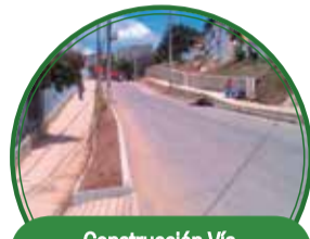
Construcción Vía de Acceso y Urbanismo Ciudad del Este $5.346 millones