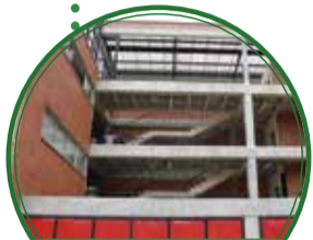
Ampliación I.E. María Madre Mazarelo $2.076 millones