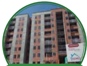
Urbanización Ciudad del Este $13.534 millones