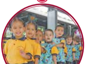
Jardín Infantil Buen Comienzo Loreto $8.400 millones