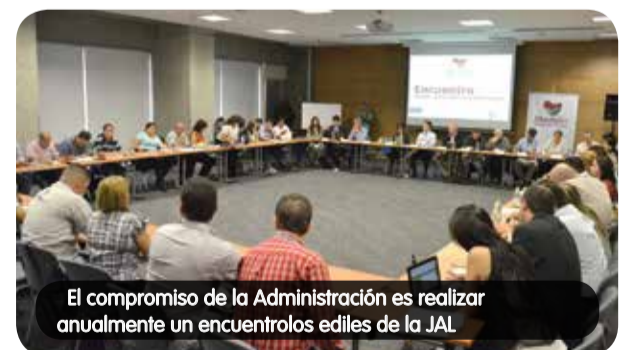
El compromiso de la Administración es realizar anualmente un encuentro con los ediles de la JAL.

El alcalde de Medellín, Aníbal Gaviria Correa, se reunió con los ediles de la Junta Administradora Local de la Comuna 9 Buenos Aires con el objetivo de hacer seguimiento a los proyectos acordados durante las Jornadas de Vida y Equidad, la ruta de ajustes y modificación al Sistema Municipal de Planeación y la actualización de planes de desarrollo local y el POT, entre otros aspectos de interés de la Comuna.