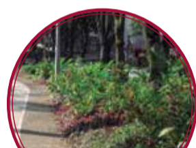
Corredor Ecológico Lineal La Cangrejita $600 millones