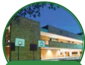
Mejoramiento de la I.E. Federico Ozanam (Fase II) $2.206 millones