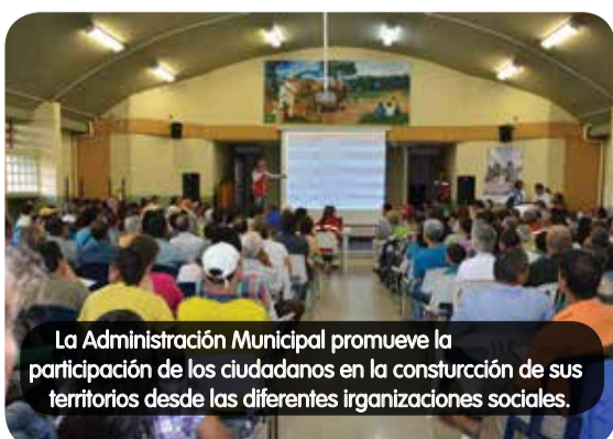
La Administración Municipal promueve la participación de los ciudadanos en la construcción de sus territorios desde las diferentes organizaciones sociales.

Las organizaciones y redes sociales de la Comuna 9 Buenos Aires avanzan con el apoyo que recibieron por parte de la Alcaldía de Medellín, con la firma de un convenio de asociación con la Asocomunal para el fortalecimiento de las juntas de acción comunal del territorio en el cual se realizará diferentes actividades, entre ellas talleres de elaboración de proyectos y otras capacitaciones. 175 personas beneficiadas.